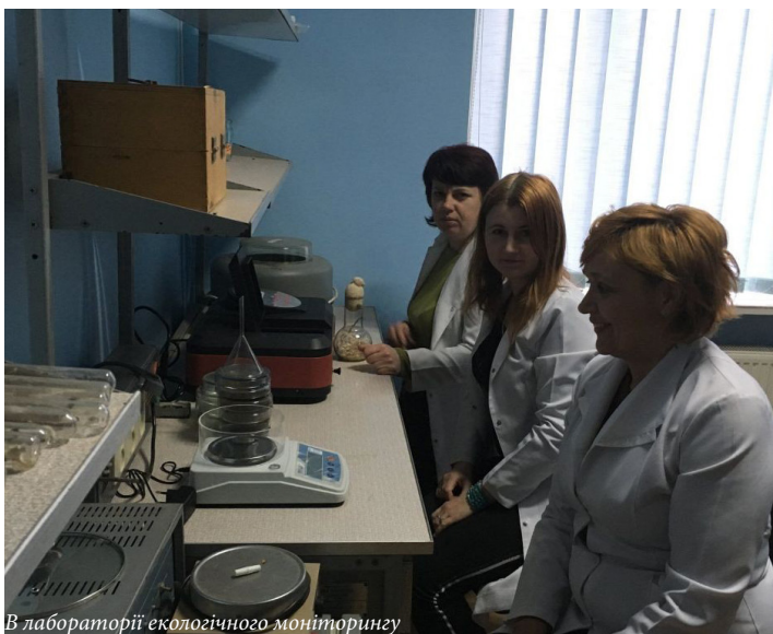
В лабораторії екологічного моніторингу

В нас діє Науково-просвітницький центр, де облаштовані кімнати-музеї мікології, ентомології, дендрології, геології,