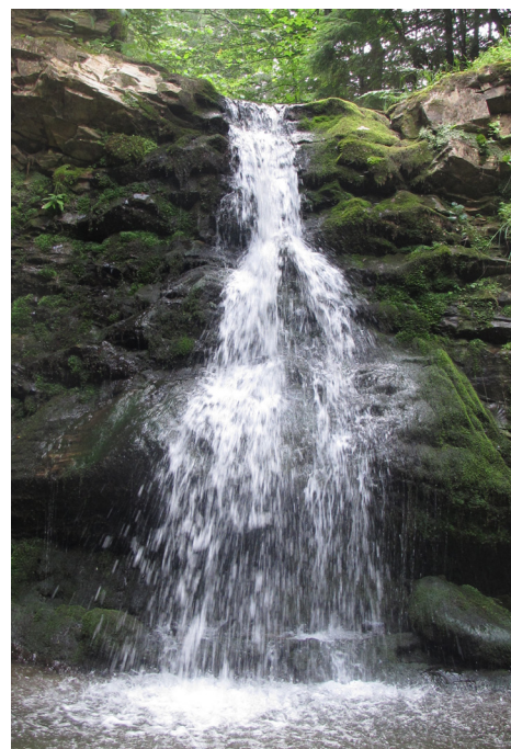
Водоспад в с. Снідавка

на території Парку поширена значна кількість лісових рослинних угруповань (понад 20 шт.) занесених до Зеленої книги України. Тому після 2010 року ППП закладалися у зазначених рідкісних угрупованнях з метою їх моніторингу та розробки заходів щодо відтворення. Станом на сьогодні у НПП «Гуцульщина» функціонує 11 ППП, серед яких найбільш репрезентативними є ППП в букових деревостанах. Це пояснюється тим, що найчисельнішими деревостанами Парку є саме букові, відповідно і найбільша кількість рідкісних угруповань виявлена в цих лісах. Практичними результатами систематичних спостережень на ППП стало підтвердження того, що штучні деревостани смереки європейської на території Косівщини, в межах абсолютних висот 360-800 м н.р.м., є, практично, приреченими на поступове всихання та на заміну корінними породами – буком лісовим та ялицею білою. Також було виявлено всихання дерев ялиці білої в Косівському ПНДВ і встановлено причини – бактерії роду Ervinia та Pseudomonas . Вжито заходів щодо припинення розповсюдження цього шкідника. На ППП №6 встановлено, що сосна кедрова європейська здатна масово шишконосити, проте, через масове поїдання недосплого насіння кедрівками, майже немає змоги відновитися, а через інтенсивний антропогенний вплив - скорочується її і так мала популяція.