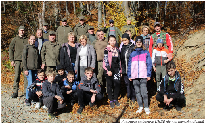
Учасники шкільного ПНДВ під час екологічної акції

фестивалі, конкурси, свята, заняття, квести тощо. У співпраці із закладами освіти у галузі екологічної освіти НПП «Гуцульщина» щорічно проводить більше 20 заходів. Так, дев'ятнадцять років поспіль, еко-фестиваль «Гірська веселка» гуртував та об'єднував юних природолюбів – здобувачів освіти освітніх закладів Косівщини, вихованців закладів позашкільної освіти, молодіжні громадські організації. Навесні 2016 року, НПП «Гуцульщина» у співпраці з сектором у справах молоді та спорту райдержадміністрації, Косівським районним та Яблунівським центрами дитячої творчості, започаткували проведення районного фестивалю «Земля – наш спільний дім». У відповідний час відбувались також конкурси «Джміль та бджілка», «Цікава загадка природи мого краю», «Лелека», «Свято зимуючих птахів», «Коляда», конкурс екологічних коміксів «Пташки взимку».