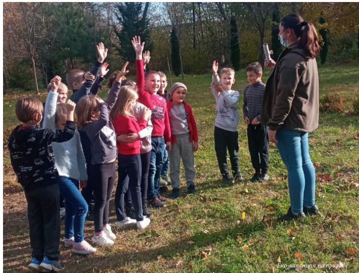
Еко заняття на природі