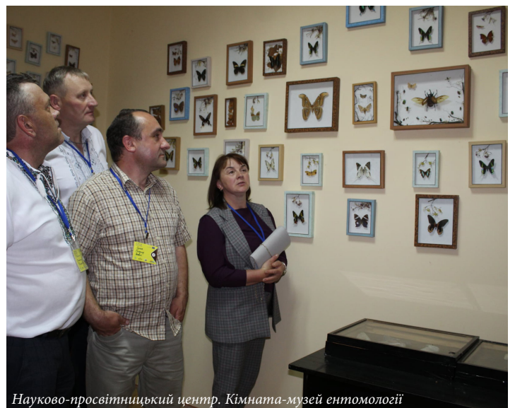
Науково-просвітницький центр. Кімната-музей ентомології