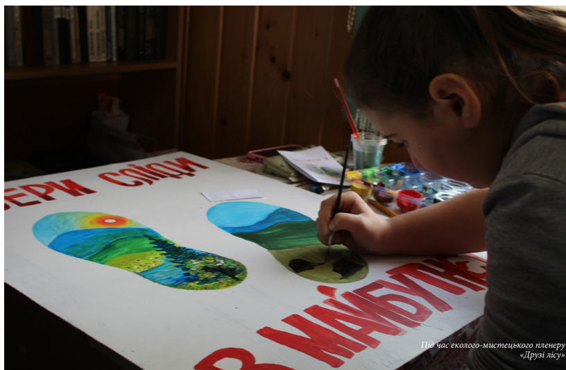
Під час еколого-мистецького пленеру «Друзі лісу»