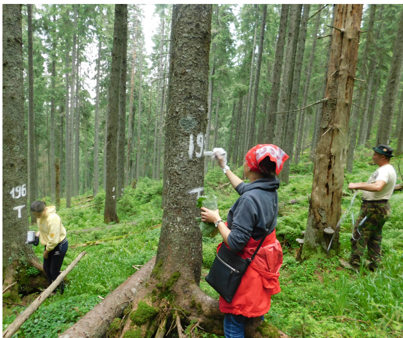
На постійній пробній площі