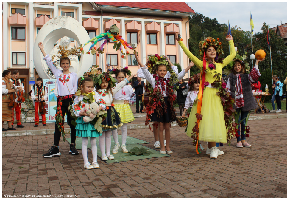
Фрагменти еко-фестивалю «Гірська веселка»